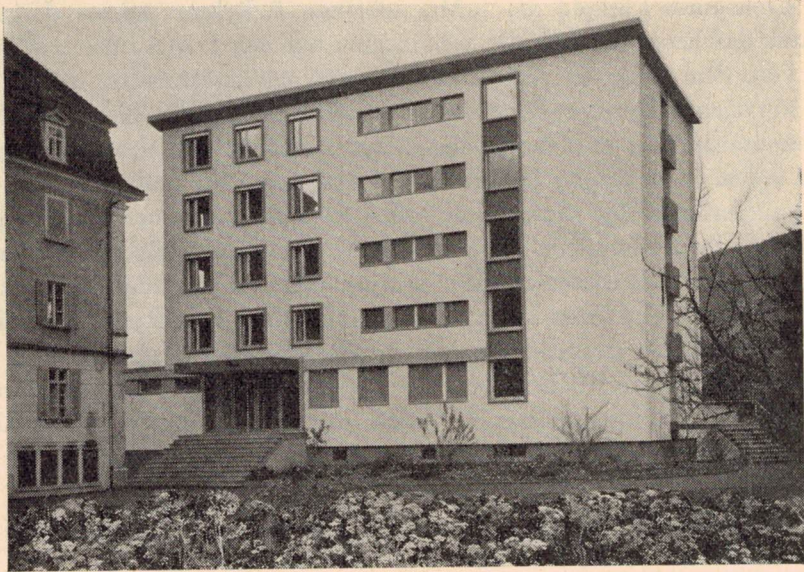
Der Neubau von Nordosten

die Handelsschule (beide Abteilungen von Ostern 1956 bis Ostern 1957). 166 Schüler besuchten das Gymnasium (10) und 59 (3) das Lyzeum (Ende September 1956 bis Mitte Juli 1957). — 256 Zöglinge (16) hatten Kost und Wohnung in den verschiedenen Internatsabteilungen, 162 (19) waren externe Schüler.